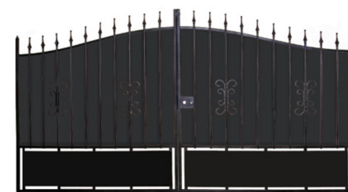
Option tôle de fond