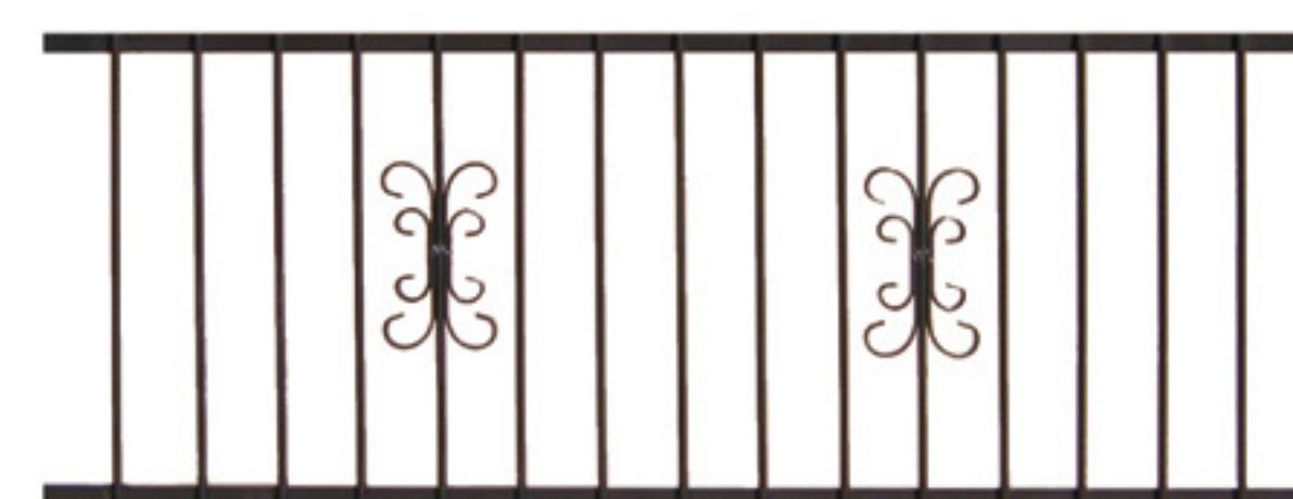
Clôture sans pointes