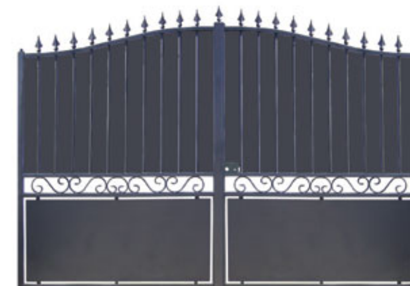
Option tôle de fond