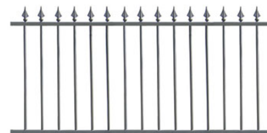
Clôture avec pointes