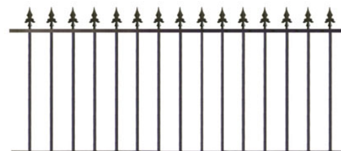
Clôture avec pointes