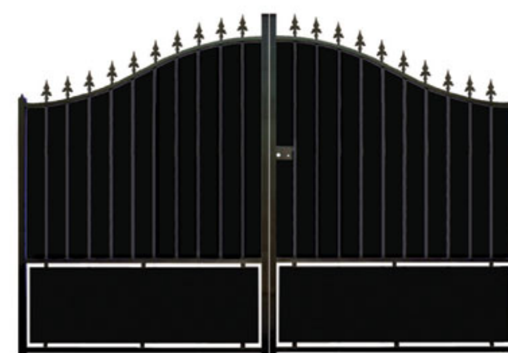
Option tôle de fond