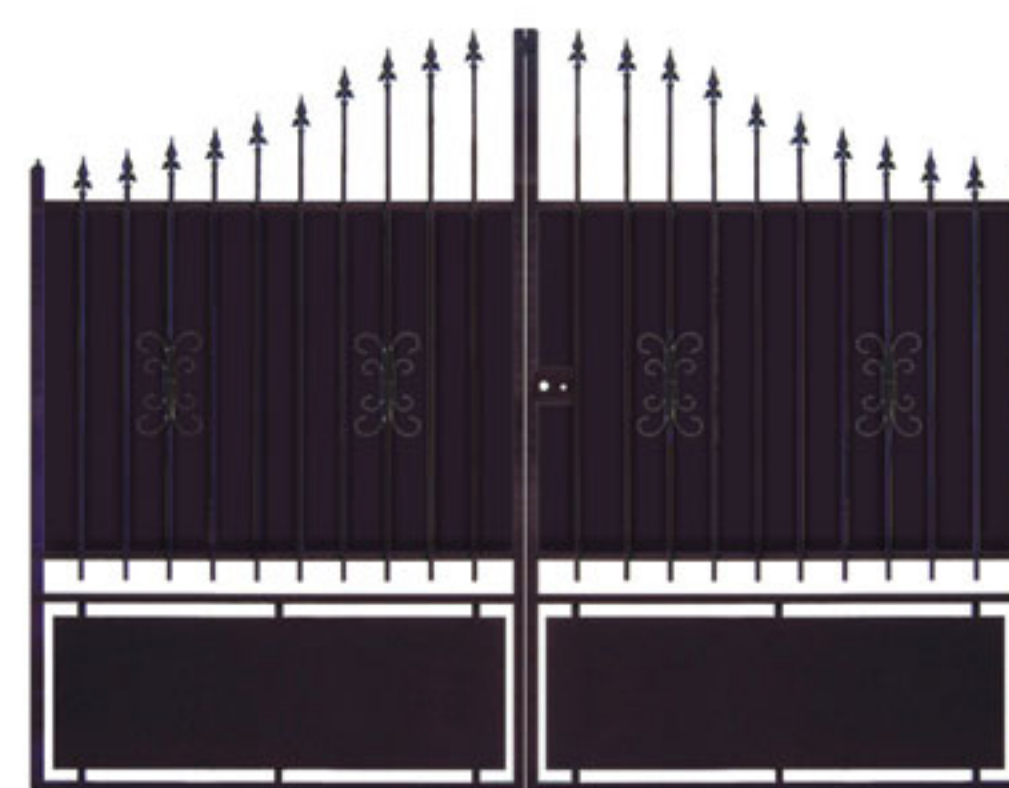
Option tôle de fond