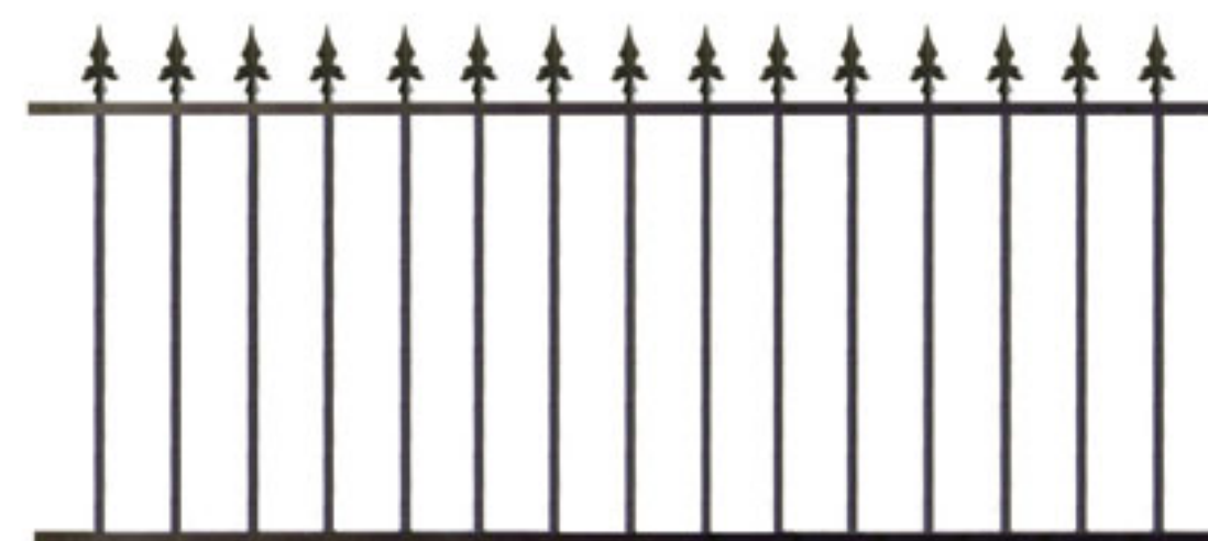
Clôture avec pointes